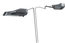
Signature LED-belysning för handskydd