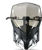
Extra hög vindruta (51 cm)