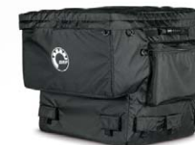
Extra stor XU-väska