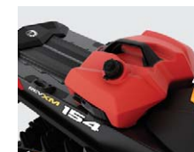
LinQ-bränsledunk, 11 L