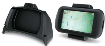
Insats för handsfacket/ Montana-GPS med fäste