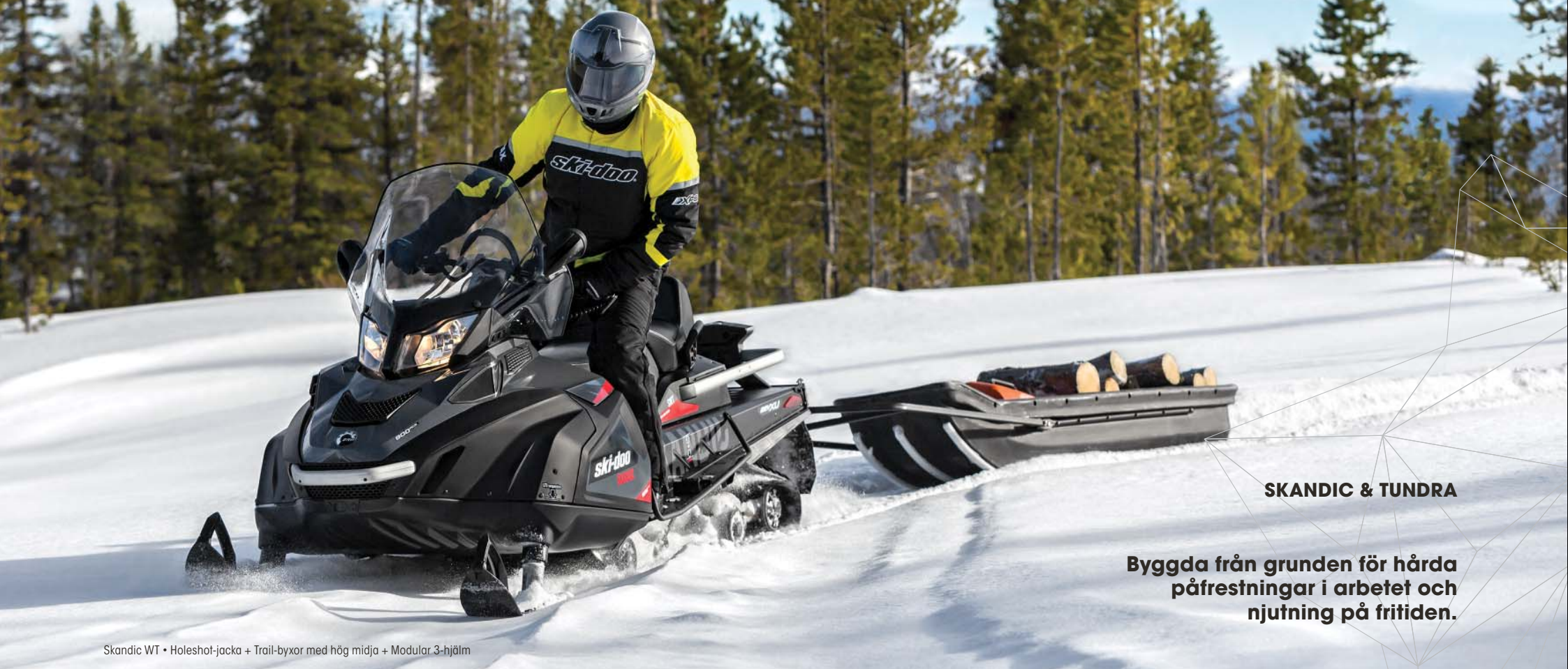
Skandic WT • Holeshot-jacka + Trail-byxor med hög midja + Modular 3-hjälm