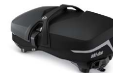
LinQ Premium-tunnelväska, kort, 10 + 3 L