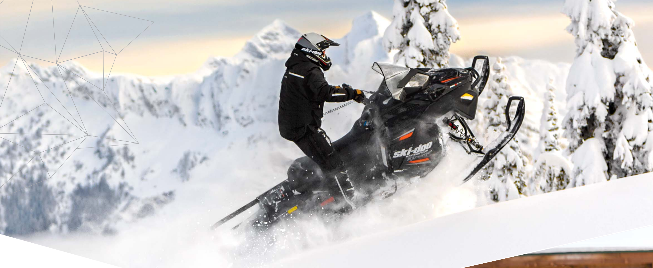
Expedition Xtreme • Expedition-jacka och -byxor + XC-4 Cross Drift-hjälm