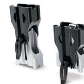
Justerbart förhöjningsblock för raka styren