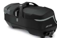
LinQ Premium-tunnelväska, medium, 19 + 3 L