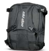
Smidig tunnelväska med mjuka LinQ-remmar