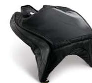
Tankväska, 5 L