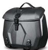
LinQ 1 + 1-ryggstövsväska