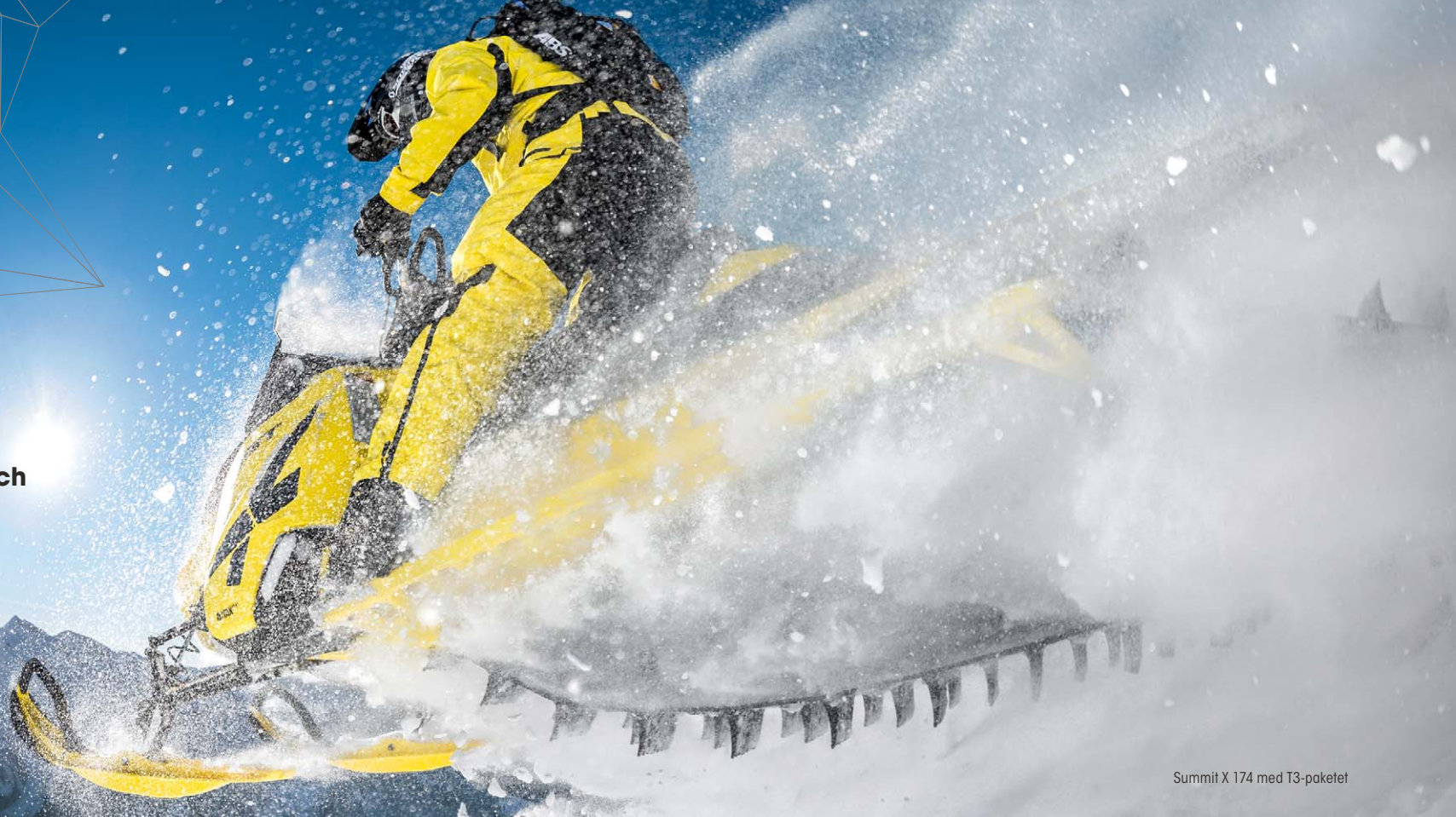
Summit X 174 med T3-paketet

Med en skoter som är så här kraftfull, funktionell och följsam så finns det inga begränsningar.