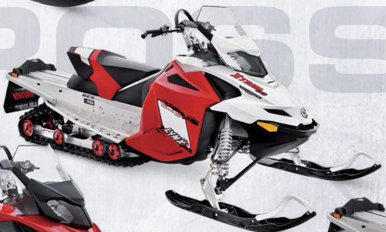
XTRIM™ SC 600 E-TEC