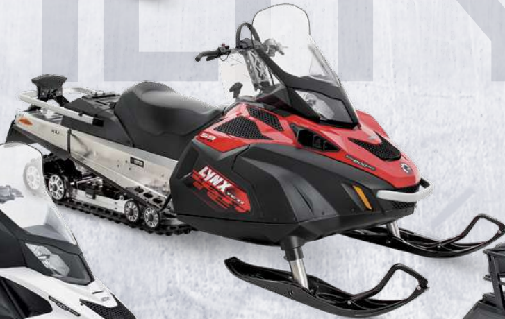
59 YETI® 600 ACE