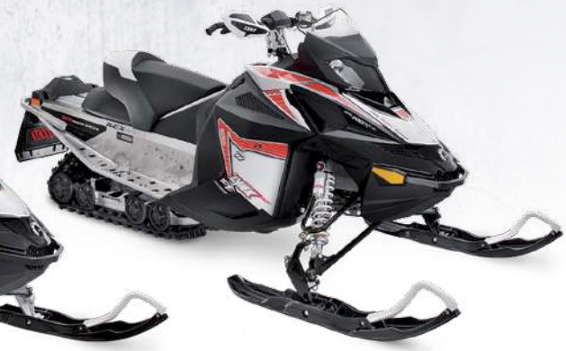
RAVE™ RE 800R E-TEC