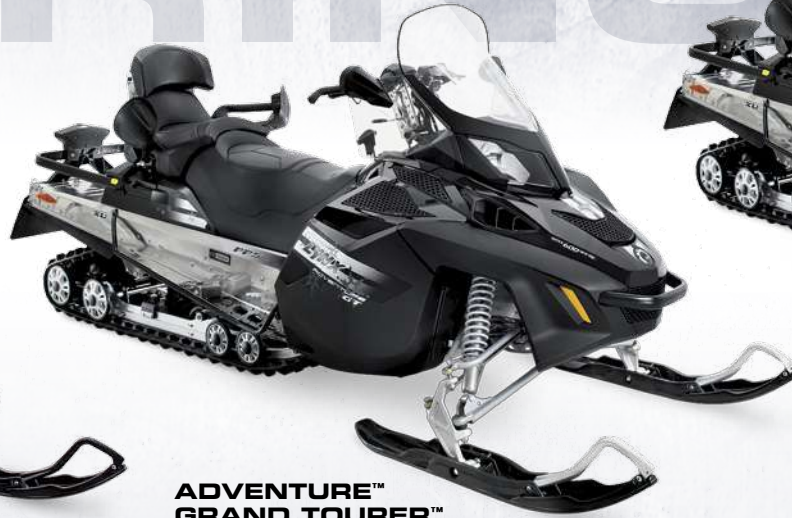
ADVENTURE™ GRAND TOURER™ 600 E-TEC