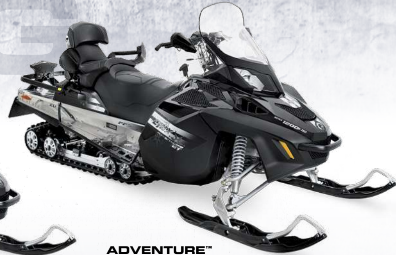
ADVENTURE™ GRAND TOURER™ 1200 4-TEC