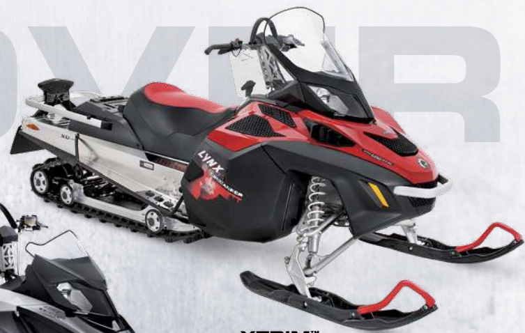
XTRIM™ COMMANDER™ 600 E-TEC