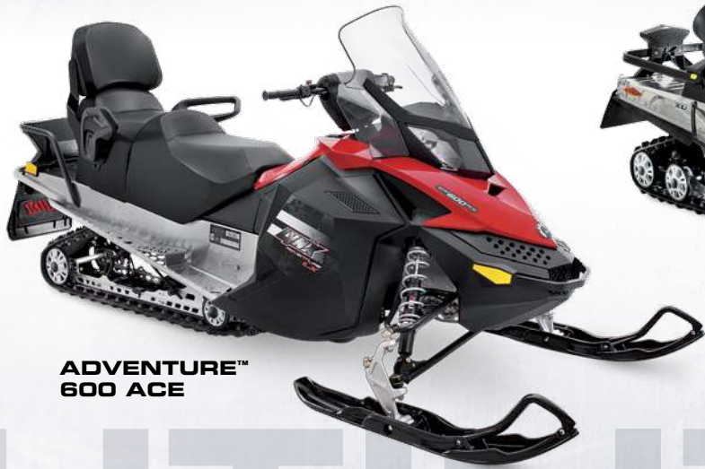
ADVENTURE™ 600 ACE