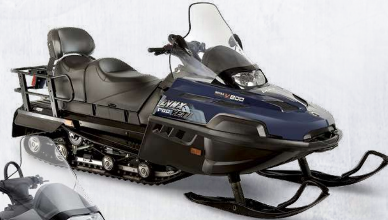
YETI® PRO V-800