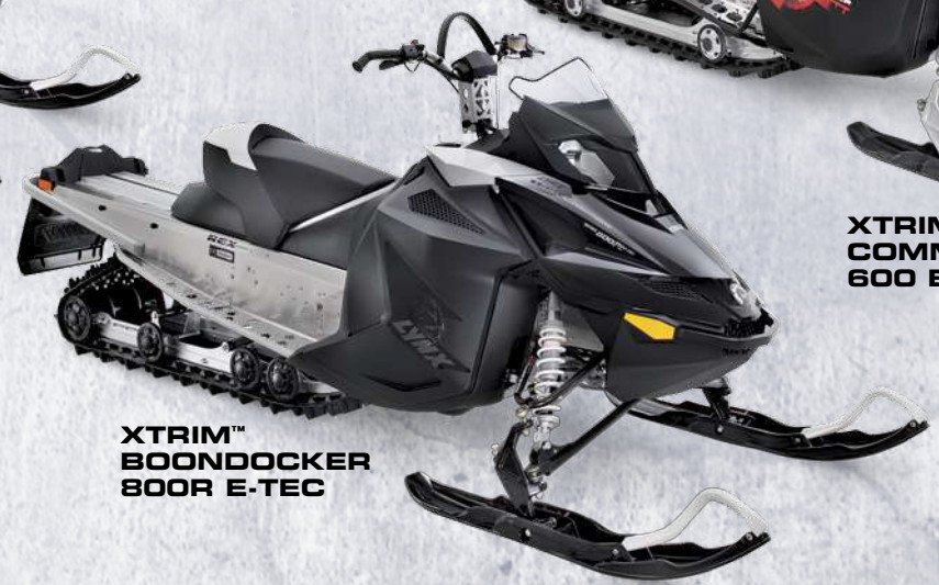
XTRIM™ BOONDOCKER 800R E-TEC