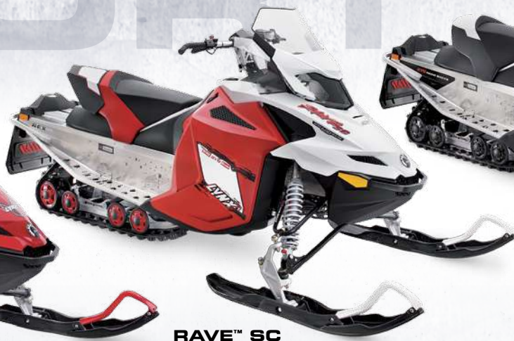
RAVE™ SC 600 E-TEC