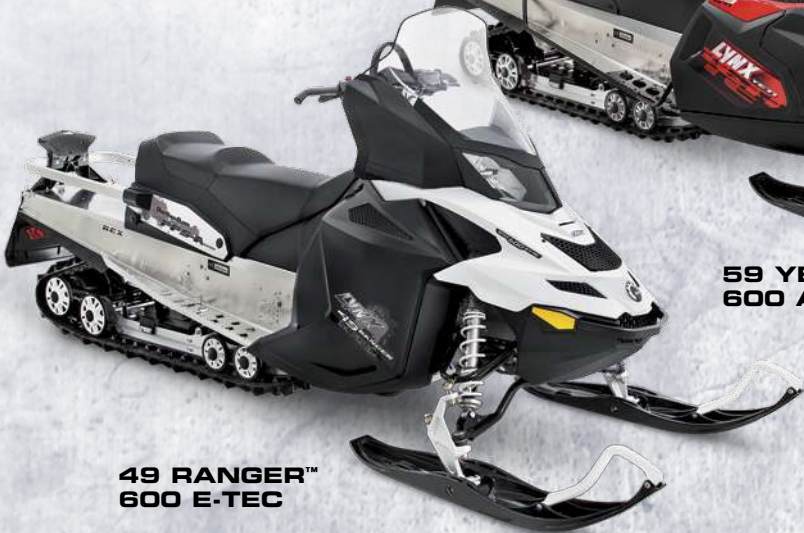
49 RANGER™ 600 E-TEC