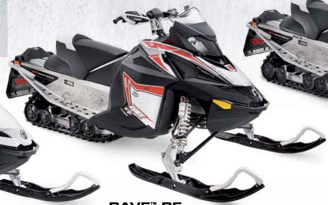
RAVE™ RE 600 E-TEC