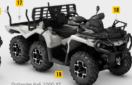
Outlander 6x6 1000 XT Forestry Package