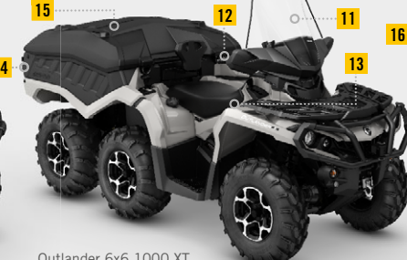
Outlander 6x6 1000 XT Winter Package