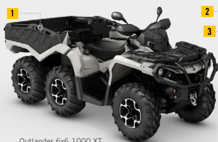
Outlander 6x6 1000 XT Side Wall Package

■ NY! Ljusgrå 1000 TRAKTOR: 137.900,- exkl. moms 172.375,- inkl. moms