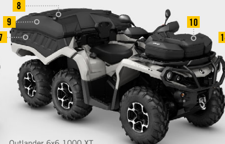
Outlander 6x6 1000 XT Cargo Package