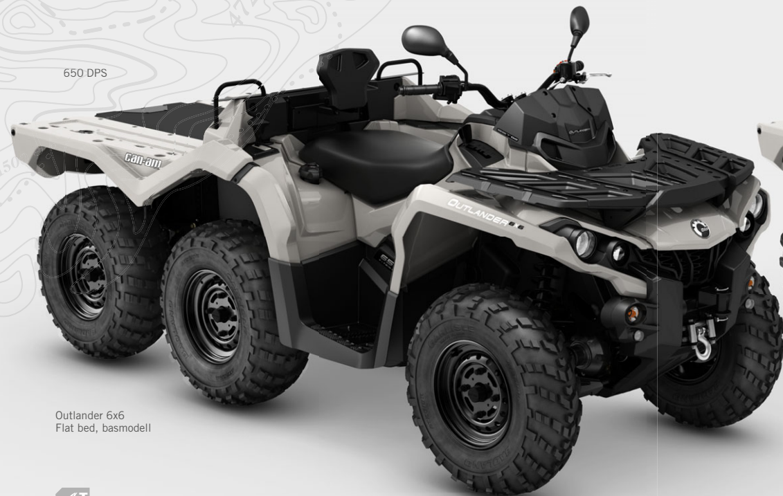
Outlander 6x6 Flat bed, basmodell