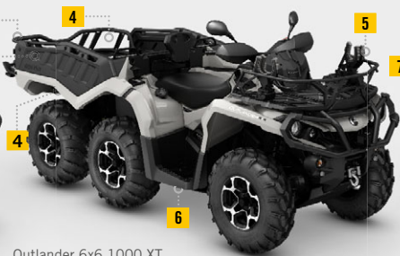
Outlander 6x6 1000 XT Farmer Package